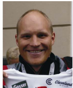
THOMAS SYKORA AUT 2004 BJÖRN EINAR ROMØREN NOR 2005 WERNER FRANZ AUT 2006 ALOIS VOGL GER 2007 2008 KALLE PALANDER FI 2005